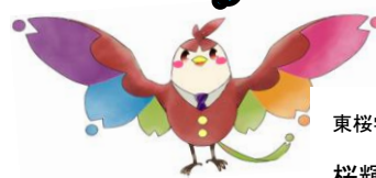
東桜学館マスコットキャラクター 桜輝 (さくらっきー)