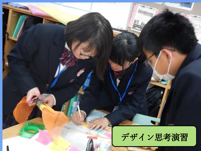
デザイン思考演習

【その他】 当日の駐車場等の情報は、後日、本校HPでご案内いたしますのでご覧ください。ご不明な点等は、中学教頭までご連絡ください。(0237-53-1541)